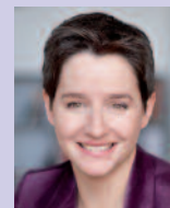
Mag. Sonja Wehsely Amtsführende Stadträtin für Gesundheit und Soziales

Wir wünschen Ihnen eine spannende Lektüre und: bleiben Sie gesund!